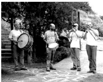
Los Gaiteros del Jiloca que nos deleitarán con su música